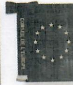
FLAG OF HONOUR

Η «Πλάκα της Τιμής» και η «Σημαία της Τιμής» απονεμήθηκαν στο Δήμο Λευκωσίας το 2014 από το Συμβούλιο της Ευρώπης για την ενεργή προώθηση του Ευρωπαϊκού ιδεώδους το 2013.